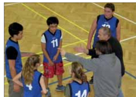
Foto z turnaje najdete na stránkách http://ddmnmmps.webnode.cz/