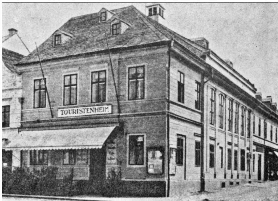
Budova Dělnického domu – dobová fotografie