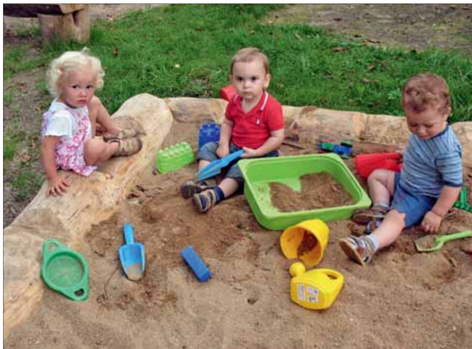
Mateřské Centrum Korálek více na str. 7 ▲