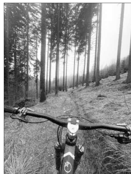
Jaro letos začalo chladně a deštivě

Ted, po skoro dvaceti letech, je v cyklistice spousta věcí jinak. Vznikla spousta nových a různých příležitostí, kde se dá jezdit (například Singltreku pod Smr-