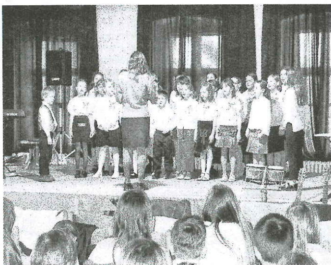
Carmínka - ZUŠ Frýdlant

Ve čtvrtek 12. dubna svá vystoupení předvedly děti z mateřských škol (Hejnice - Zvoneček, Lázně Libverda, Frýdlant - Vlaštovky, Nové Město pod Smrkem - Smrček) a malý Podsmrkáček z naší školy. V pátek 13. dubna vystupovali žáci základních a základních uměleckých škol (ZŠ Jindřichovice pod Smrkem - Ptáčata, ZŠ Frýdlant - Bělíkova ul., ZŠ Dolní Řasnice, ZŠ Višňová - Klíček, ZŠ Raspenava - Hlásek, Včelky, ZUŠ Frýdlant - Carmínka, ZUŠ Nové Město pod Smrkem - velký Podsmrkáček). Vystoupení se všem dětem vydařilo a nechyběla ani společná písnička „Holka modrooká“.