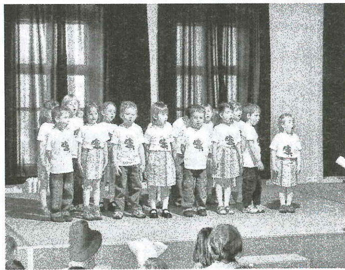
Smrček - MŠ Nové Město pod Smrkem

Máme radost z toho, že se každým rokem setkáváme v Novém Městě pod Smrkem v tak velkém počtu, a těšíme se již nyní na další společné zpívání. Městskému úřadu v Novém Městě pod Smrkem děkujeme za poskytnutí grantu na tuto akci.